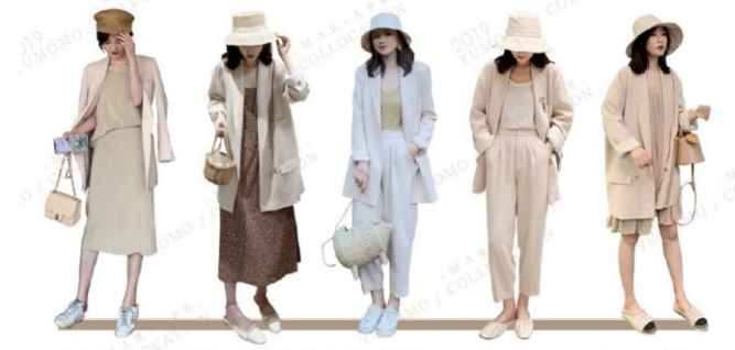
HAVE A LIKING FOR TO THE VOGUE AND THE FUNCTION some people say that loneliness is shameful | but fashion is a means of resistance alone | this is fashion realm YUMOMO