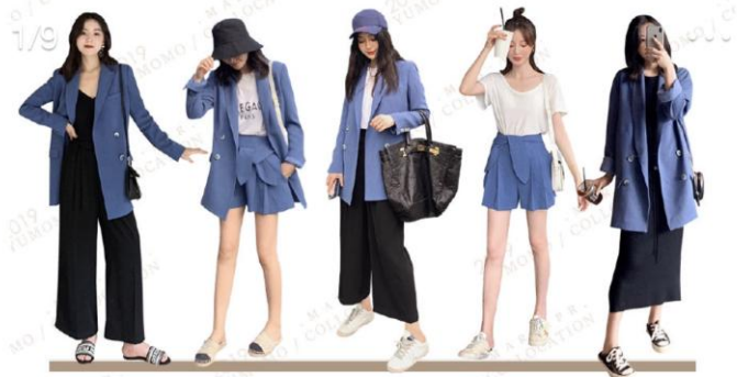
1/9 HAVE A LIKING FOR TO THE VOGUE AND THE FUNCTION some people say that loneliness is shameful | but fashion is a means of resistance alone | this is fashion realm YUMOMO