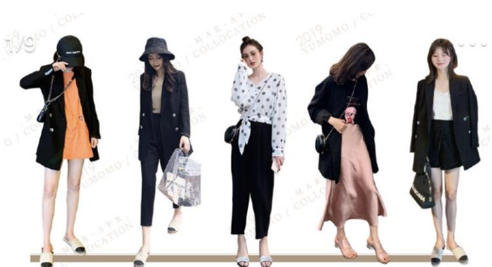
HAVE A LIKING FOR TO THE VOGUE AND THE FUNCTION