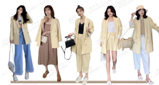
HAVE A LIKING FOR TO THE VOGUE AND THE FUNCTION some people say that loneliness is shameful | but fashion is a means of resistance alone | this is fashion realm YUMOMO