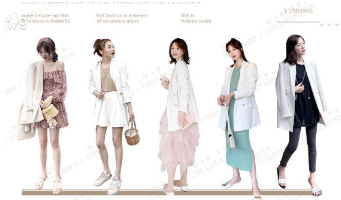
HAVE A LIKING FOR TO THE VOGUE AND THE FUNCTION