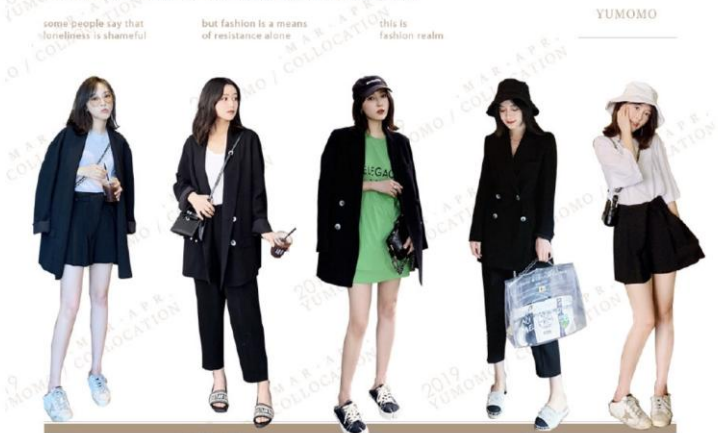
HAVE A LIKING FOR TO THE VOGUE AND THE FUNCTION