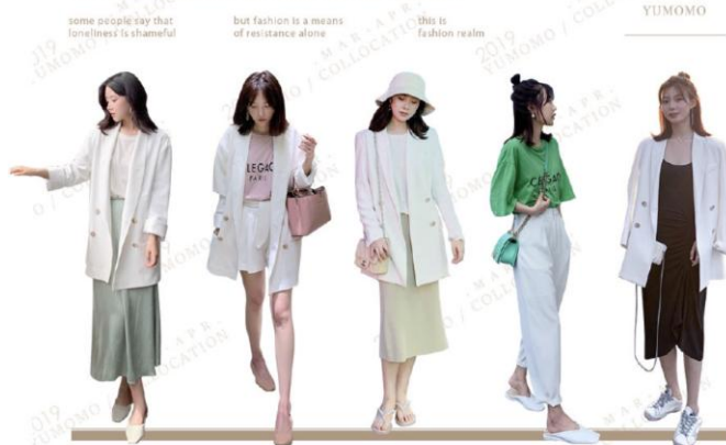
HAVE A LIKING FOR TO THE VOGUE AND THE FUNCTION