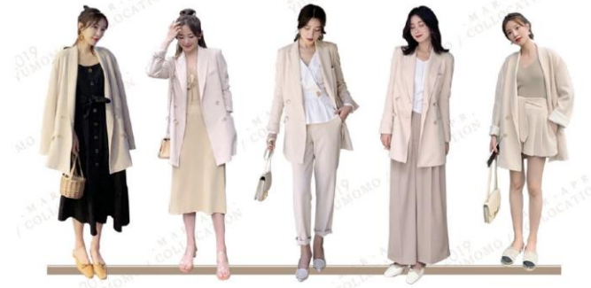
HAVE A LIKING FOR TO THE VOGUE AND THE FUNCTION some people say that loneliness is shameful | but fashion is a means of resistance alone | this is fashion realm YUMOMO