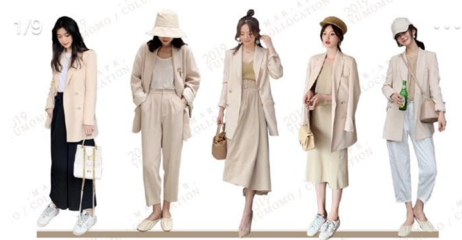
1/9 HAVE A LIKING FOR TO THE VOGUE AND THE FUNCTION some people say that loneliness is shameful | but fashion is a means of resistance alone | this is fashion realm YUMOMO